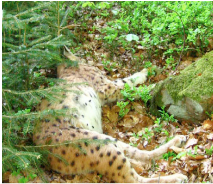
Vier tote Luchse: Diese im Mai 2013 bei Bodenmais erschossen aufgefundene Luchsin war mit drei Jungen trächtig

Die verschiedensten Verbände aus Landwirtschaft, Jagd und Naturschutz erarbeiteten damals diesen Plan mit dem Ziel, dem Luchs in Bayern dauerhaft ein Überleben zu sichern. So steht als erstes Ziel in den verabschiedeten Leitlinien der Wunsch nach einer vitalen Luchspopulation, die ihren Lebensraum selbst wählt und alle Lebensräume in Bayern besiedeln darf. Die Akzeptanzförderung wurde darauf ausgerichtet, dass der Luchs von der Öffentlichkeit und von unmittelbar betroffenen Bevölkerungsgruppen wie Jägern, Landwirten und Waldbesitzern als natürlicher Bestandteil der Fauna Bayerns toleriert wird. Um die Akzeptanz in der Jägerschaft zu erhöhen, wurde sogar vereinbart, dass der Revierinhaber als Jäger im Rahmen seines Abschussplanes eigenverantwortlich auf das Auftreten eines Luchses „reagieren“ darf. Das heißt: Wenn der Jäger einen Luchs in seinem Revier bemerkt, braucht er nicht mehr so viele Rehe abzuschießen, wie er eigentlich verpflichtet wäre, weil ja der Luchs quasi in seinem Revier mitjagt.